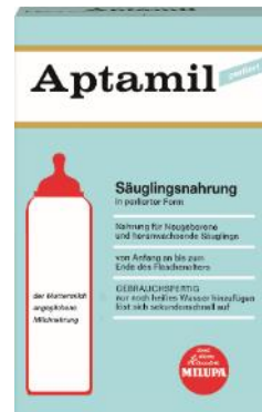
Aptamil Säuglingsnahrung, 1968