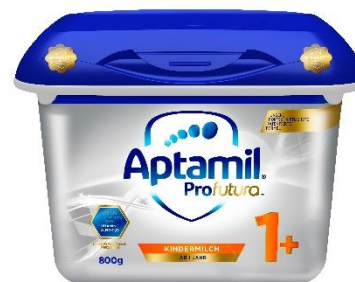
Aptamil Profutura™ Kindermilch 1+ ab 1 Jahr