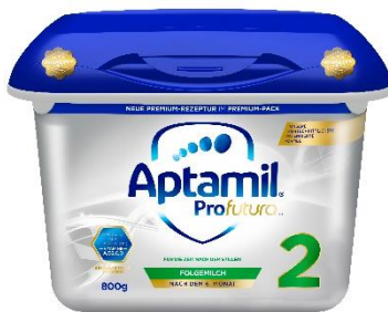
Aptamil Profutura™ Folgemilch 2 nach dem 6. Monat